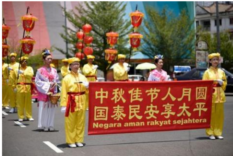
马来西亚法轮功学员游行庆中秋

一年一度的中秋佳节即将来临。二零一六年九月四日，马来西亚法轮功学员分别来到雪兰莪州两个繁华城镇，班丹英达（Pandan Indah）和八打灵再也（Petaling Jaya），举办了游行活动，提前与民迎接中秋佳节的到来，弘扬传统文化，把法轮大法的美好带给当地民众，受到各族民众的欢迎，也让老居民喜闻真相。