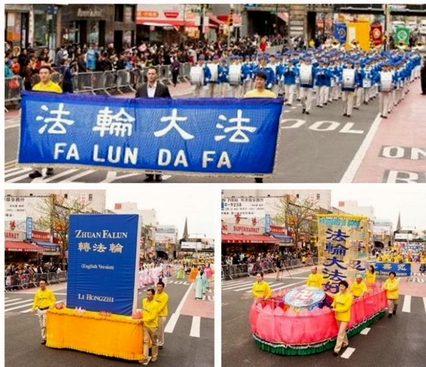
四二五 纽约法拉盛游行盛大登场

二零一六年四月二十三日（星期六），近千名法轮功学员在纽约最密集的华人社区——法拉盛举行了盛大游行，纪念“四·二五”和平上访十七周年。游行队伍分为三个大方阵，声势浩大，街道两边挤满了观看的民众。街道两旁的观众纷纷拿出手机拍照，许多观众赞美，表示反对迫害，支持法轮功。