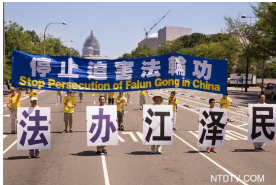
美中人权对话 法轮功吁法办江泽民

第 19 轮美中人权对话在美国华府举行，8 月 14 日部份华府法轮功学员在美国国务院外手持横幅，要求中共立即停止对法轮功学员的迫害，并声援中国大陆法轮功学员起诉迫害元凶江泽民。