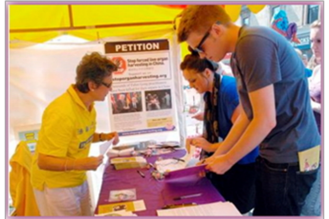
民众签名支持反迫害

摊位里展示的是法轮功在中国遭受迫害的事实以及征签表。自一九九九中共迫害法轮功以来，海外法轮功学员多年来持续参加各种社区活动，向国际社会揭露中共迫害法轮功的真相，呼吁制止迫害，使越来越多的民众了解了什么是法轮功以及迫害真相，并发出声援以不同的形式支持反迫害。◇英国法轮功学员