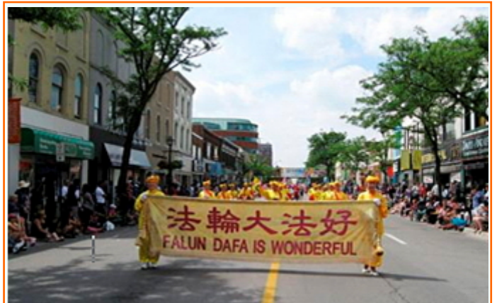
在加拿大（Brampton）花节游行中的腰鼓队