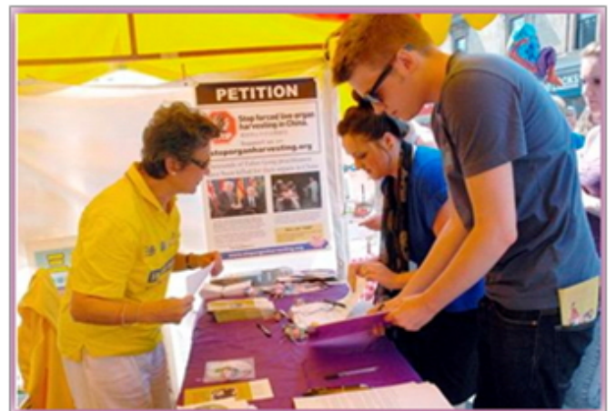
民众签名支持反迫害

摊位里展示的是法轮功在中国遭受迫害的事实以及征签表。自一九九九中共迫害法轮功以来，海外法轮功学员多年来持续参加各种社区活动，向国际社会揭露中共迫害法轮功的真相，呼吁制止迫害，使越来越多的民众了解了什么是法轮功以及迫害真相，并发出声援以不同的形式支持反迫害。◇英国法轮功学员