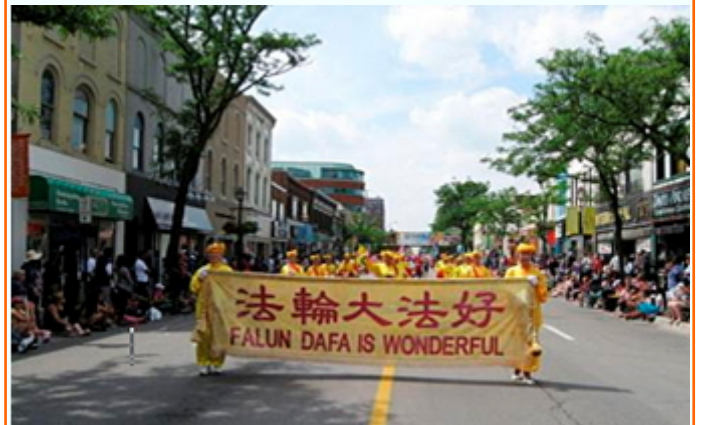
在加拿大（Brampton）花节游行中的腰鼓队