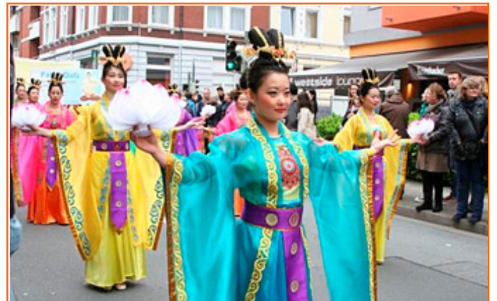
德国多元文化节 法轮功受瞩目