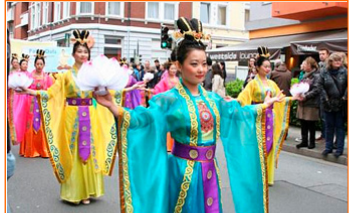
德国多元文化节 法轮功受瞩目