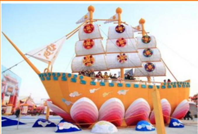
台湾灯会全世界最大法船满载希望