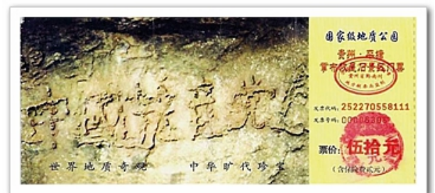
图为贵州省平塘县风景区门票上的中国共产党亡

2002年6月，贵州省平塘县惊现距今2.7亿年的巨石，上面有天然形成的六个大字：中国共产党亡，这就是天意在人间的显现。那么到了今天为什么中共僵而不倒、亡而不死呢？就是为了更多的世人能明白真相，能得救才被法轮功的师父一而再、再而三的延长时间。可贵的中国同胞，静下心来看看真相资料吧，了解了解法轮功吧，千万年的等待就是为了今天在法轮大法洪传时能得救，错过了这个万古难遇的机缘，将是自己永远的痛悔！