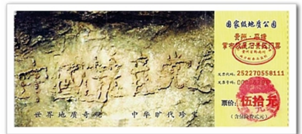
图为贵州省平塘县风景区门票上的中国共产党亡

2002年6月，贵州省平塘县惊现距今2.7亿年的巨石，上面有天然形成的六个大字：中国共产党亡，这就是天意在人间的显现。那么到了今天为什么中共僵而不倒、亡而不死呢？就是为了更多的世人能明白真相，能得救才被法轮功的师父一而再、再而三的延长时间。可贵的中国同胞，静下心来看看真相资料吧，了解了解法轮功吧，千万年的等待就是为了今天在法轮大法洪传时能得救，错过了这个万古难遇的机缘，将是自己永远的痛悔！