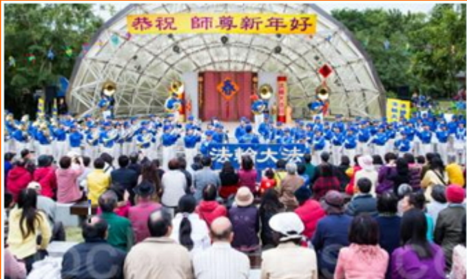
台湾上千法轮功学员向师尊拜年