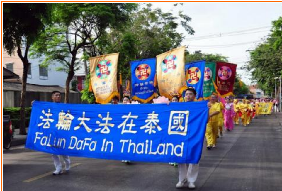
法轮功队伍曼谷游行受欢迎