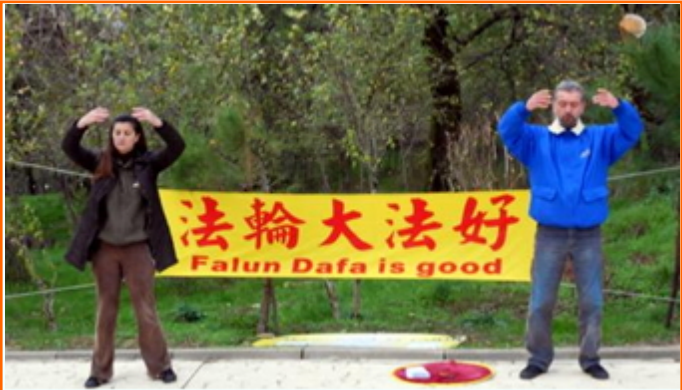
在阿尔巴尼亚、黑山、马其顿介绍法轮功