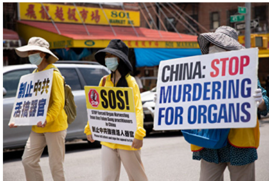
2021 年 7 月 18 日，法轮功学员在纽约布鲁克林参加反迫害 22 周年游行。