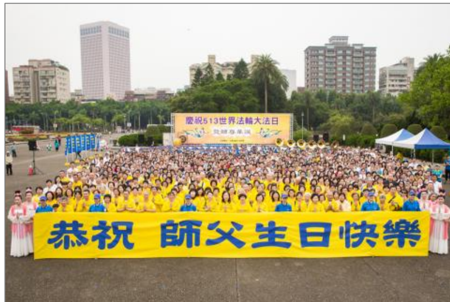
台北法轮功学员庆祝世界法轮大法日

5月1日在大陆游客必到的台湾国立国父纪念馆观光景点，有约千名台北的部分法轮功学员热闹举办“庆祝五一三世界法轮大法日暨恭祝师尊华诞”活动，现场布置的法轮大法洪传世界图片展，以及众多的文艺节目表演和法轮功学员集体炼功展示五套功法，吸引来往的民众和大陆客驻足观看。