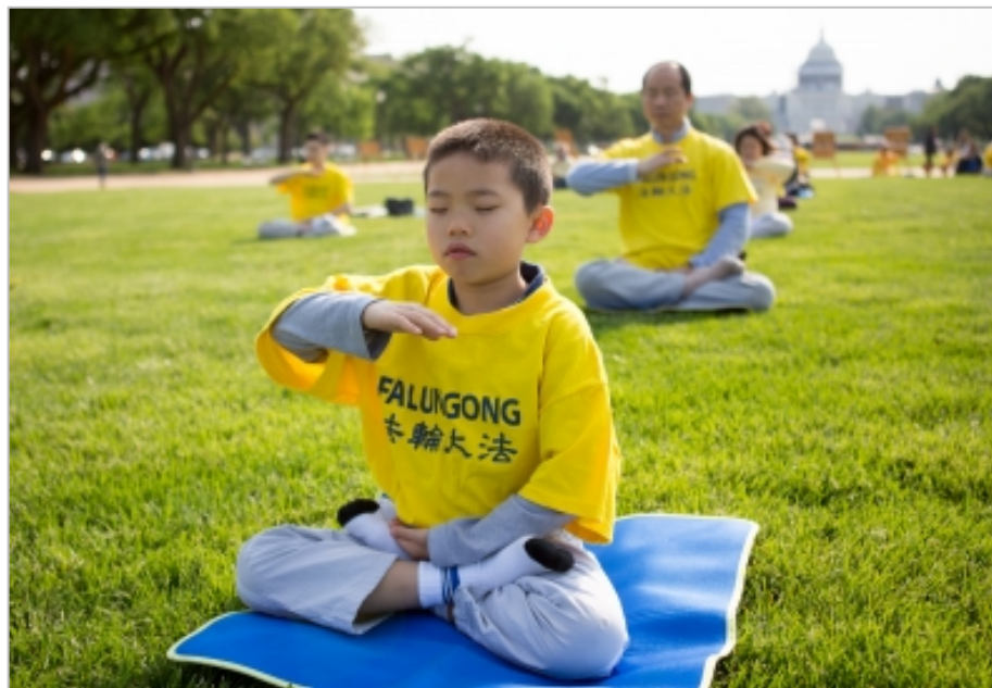
小弟子在华盛顿 DC 国家广场上参加集体炼功