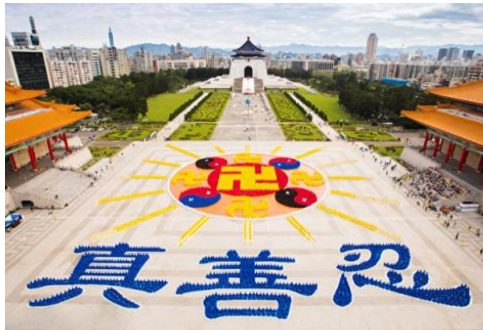
壮观殊胜 台湾 6300 人排成巨大法轮图形

台湾法轮功一年一度的排字活动，11月26日在中正纪念堂举行，来自台湾及世界各地的部分法轮功学员约6,300人排出壮观图像“法轮图形”。17年来都担任图像设计的吴清祥表示，“法轮图形”是法轮大法的标记，是宇宙的缩影。他们希望透过排字艺术呈现法轮大法的殊胜，让大家有机会了解、认识法轮功。