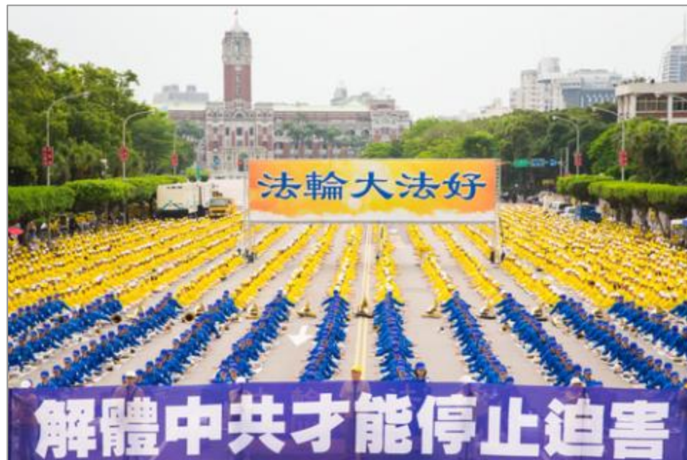
台法轮功集会纪念 425 上访与声援 2 亿人三退