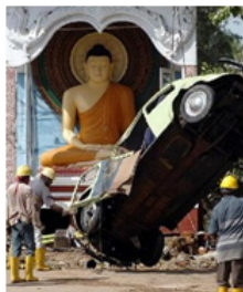
斯里兰卡加勒寺 庙前，佛像在南亚海 啸侵袭中丝毫无损。