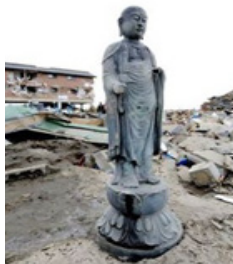
2011年3月11日日 本宫城县名取市，一尊 地藏菩萨像矗立在被海 啸摧毁的废墟上。