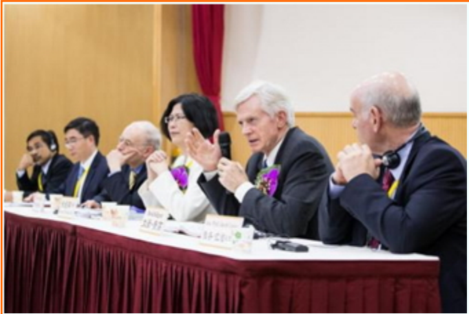
国际专家台湾疾呼 制止中共活摘器官