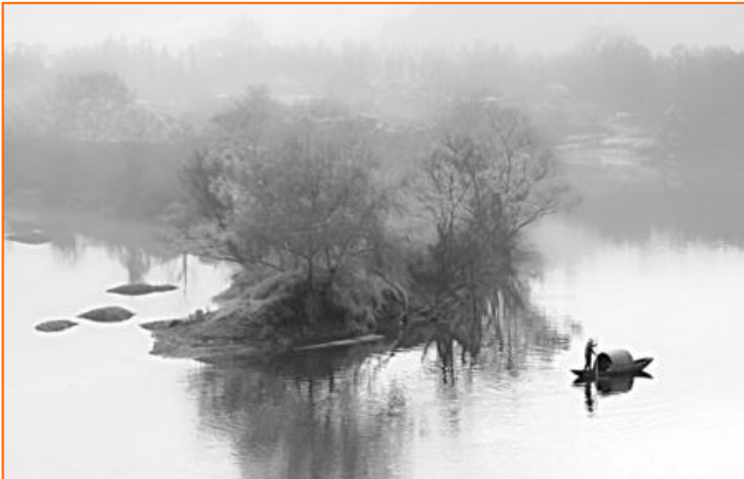
全球华人摄影作品大奖赛风光类银奖作品 《红尘》