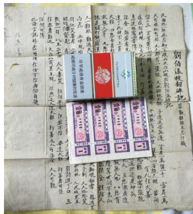
图 1：人们在猜度这四句谜题的真义

中国传统认为，预言是圣者高人穿越时空洞悉未来后给世人留言的启示，从来不会直白道明天机，而以奥妙谜语的方式流传，其特点是必须等那个时间点到来，预言的真相玄机才能让人知晓，从而洞知天意，从善如流，顺天而行，度过劫难而得平安长久。